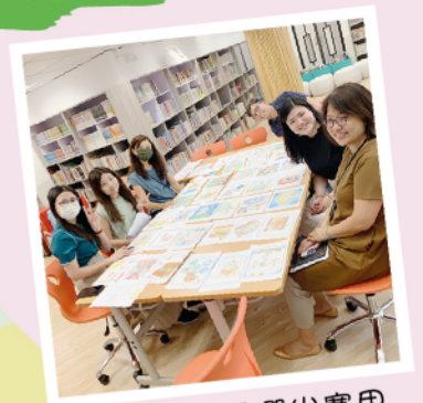
教師們共同選出賽果

本年度的閱讀主題為「書籍是智慧的鑰匙～閱讀的寶藏」，因此我們舉行這項比賽讓親子發揮創意，為本校設計閱讀紀錄冊的封面，希望這本小冊子能成為同學們個人閱讀的歷程檔案。是次比賽反應非常踴躍，共收到超過500份作品，感謝各家長及同學積極參與。