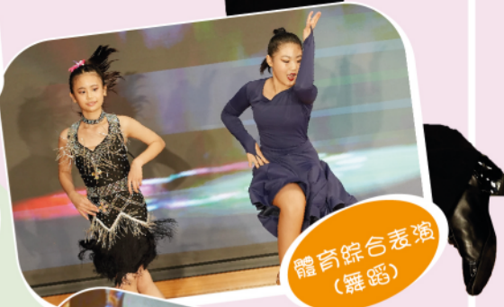
體育綜合表演 (舞蹈)