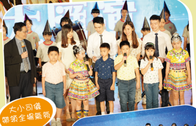
大小司儀 帶領全場氣氛