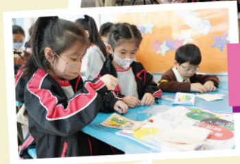
學生們積極參與福音周攤位

活動希望讓學生明白及學習基督捨己的愛，當中有背金句及「愛實踐」的攤位活動、學習祈禱敬拜的活動和福音電影，學生非常踴躍參與，盼望主繼續讓更多同學經歷祂的真實，阿門！