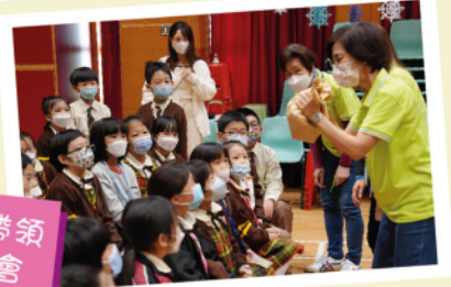
邀請「魚佈道」帶領12月的福音佈道會