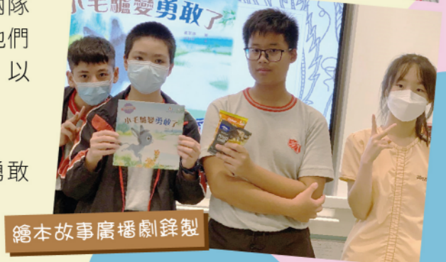
繪本故事廣播劇錄製

本年度，普通話大使亦錄製繪本故事〈小毛驢變勇敢了〉，讓初小學生聆聽以普通話演說的有趣故事。