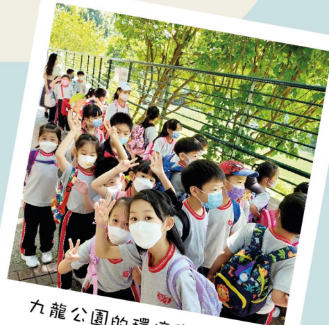
九龍公園的環境真優美！

一至三年級的同學們都在考察場地認識了大量動植物的名稱和外觀，他們亦細心觀察動物的動作、姿態以及生活習性；此外，他們可在園內亦閱覽各類動植物的特別資訊，途中即時繪畫出他們的所見所聞。