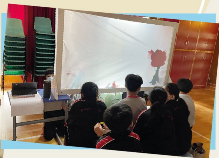
同學們的認真地綵排