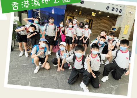
五年級 香港濕地公園