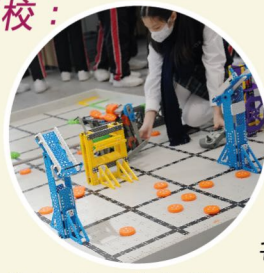
參觀東涌天主教學校