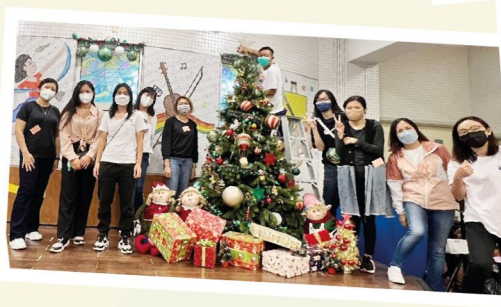
家長義工聖誕佈置