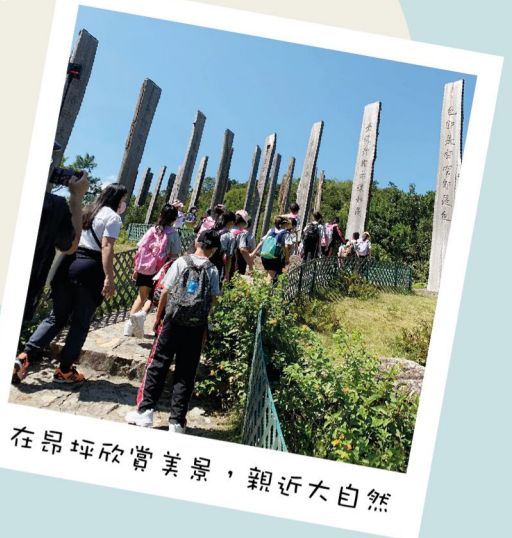
在昂坪欣賞美景，親近大自然

透過全方位的學習形式，同學們不再紙上談兵，他們親歷其境地觀賞各樣事物，學習到各方面的知識，收穫豐富。