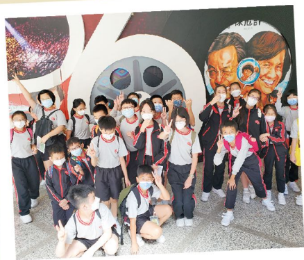
參觀沙田文化博物館展館