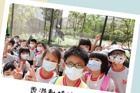
香港動植物公園 讓同學們大開眼界