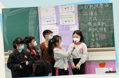
自訂物品測試匯報