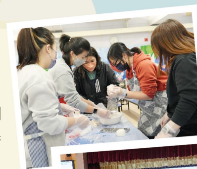
宗教會活動 製作蘿蔔糕

良好的家校合作關係對學生成長尤其重要，我們衷心感激家長義工為本校提供協助，故此我們定期舉辦不同家長活動，促進家校合作。