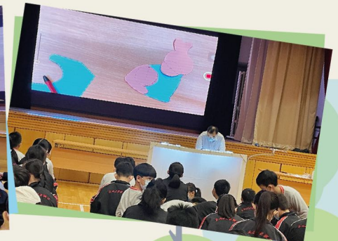
學生以大課形式學習相關技巧