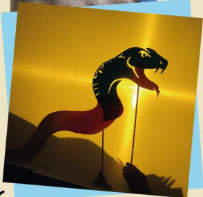
皮影戲以漂亮的光影效果吸引觀眾的注意