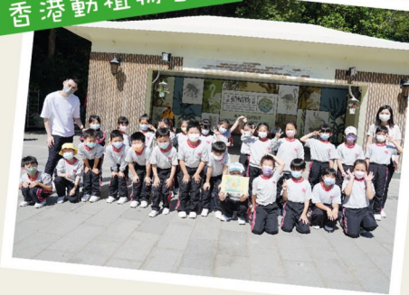
二年級 香港動植物公園