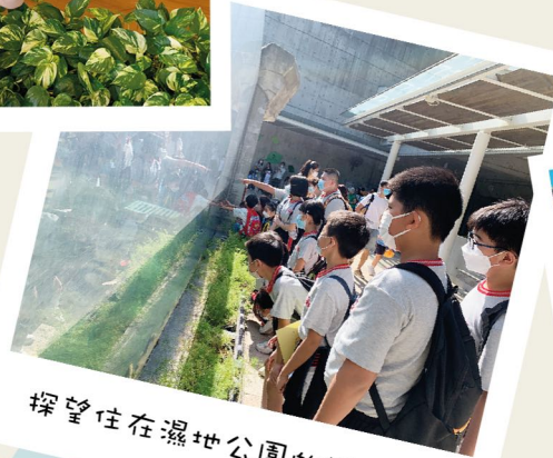
探望住在濕地公園的鱷魚貝貝