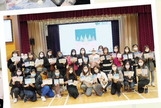
家長義工聚會暨和諧粉彩工作坊