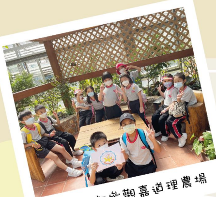
大家一起參觀嘉道理農場