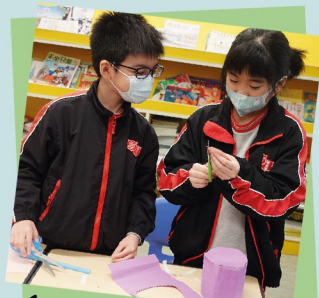
分組製作立體模型 機師入職訓練