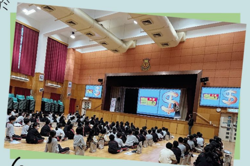
認識如何成為精明消費者