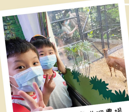
大家一起參觀嘉道理農場